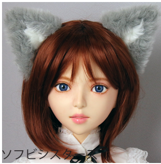
ソフビシスターズ

※獣耳は、マグネット（ネオマグ）を使っています。 お取扱いの際には、以下の注意点を守って、ご利用をお願いします。